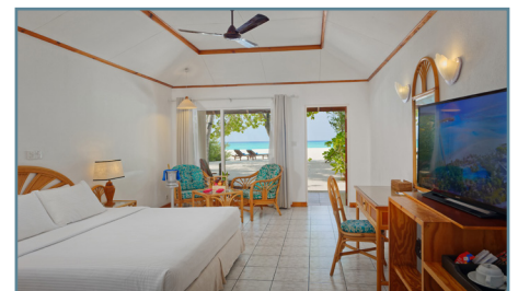
Villa Park, Sun Island - Deluxe Beach Villa