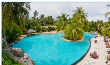
Villa Park, Sun Island - La piscina