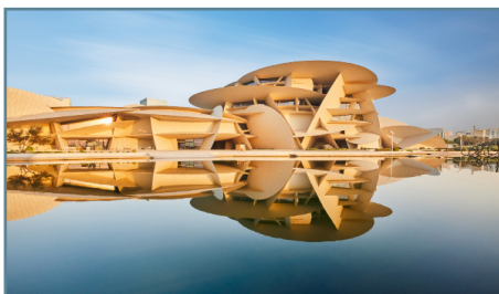
Doha, National Museum of Qatar